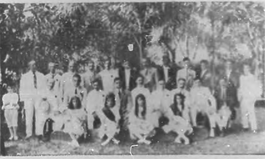
Presidencia y Comisión de la gira celebrada en los jardines de "Palatino", por la "Unión Vallisoletana".

Cuenta dicho joven además ocho medallas de plata, obtenidas como