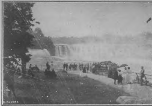
Vista de las cataratas del Niágara.

Para más informes, reservaciones y billetes, dirigirse a la PENINSULAR & OCCIDENTAL STEAMSHIP Co. O'Reilly 4. Teléfono A-6578 — HABANA.