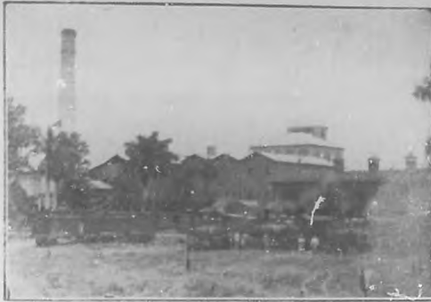
CENTRAL HORMIGUEROS EN LA PROVINCIA DE SANTA CLARA.—Ha sido notable la producción de este central durante la última zafra consistente en 219.457 sacos de azúcar.

La casa Lange y Co.—La activa e inteligente representación de esta importante casa, de New York, comprendiendo la imposibilidad y viendo las dificultades que presenta la importación de las elegantes e incomparables máquinas "Fiat", por algunos meses únicas que hasta ahora llegaban desde que comenzó la guerra, han pensado unir a los ligeros y vistosos "Overland", de los que ya tienen la representación, y han vendido una gran cantidad, el automóvil más perfecto de los