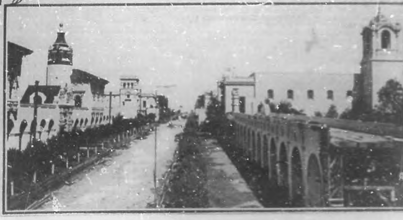
EXPOSICION DE ARTE ARQUITECTONICO EN SAN DIEGO DE CALIFORNIA.—Notables edificios cuya construcción responde a estilos de pureza clásica.—Modernismo americano.—Hoteles en cuya construcción se ha ideado la manera de que todas las habitaciones tengan sol y brisa, etc.—Reproducción de los estilos arábigo y del Renacimiento.—El costo del tipo de estos hoteles es de dos millones de dólares.—