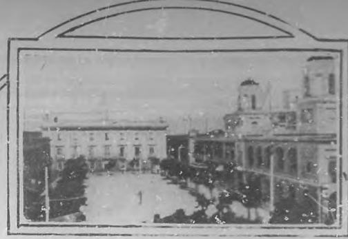
PUERTO RICO.—PLAZA DE ARMAS.