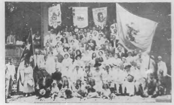
Concurrentes a la fiesta celebrada en los jardines de Palatino por la "Vallisoletana", a la que acudieron distinguidos elementos de nuestra sociedad.

Hizo sus estudios primarios en el colegio La Salle de esta capital, después marchó a los Estados Unidos, en donde luchando con la dureza del alma por su total abstracción, consiguió tantos triunfos.