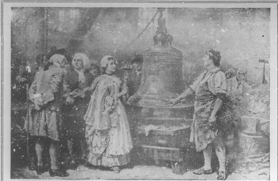
La campana de la Libertad de los Estados Unidos de América.—Célebre cuadro de J. L. Feris.